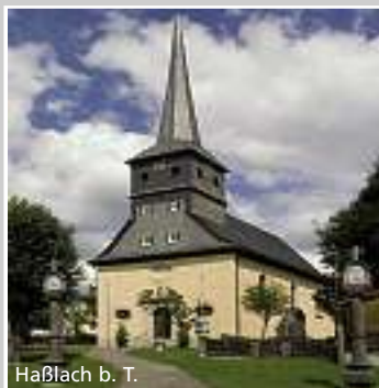
Haßlach b. T.

Hotel An der Eiche*** Tel. 09221/8780950