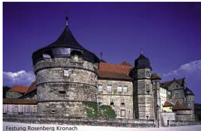
Festung Rosenberg Kronach